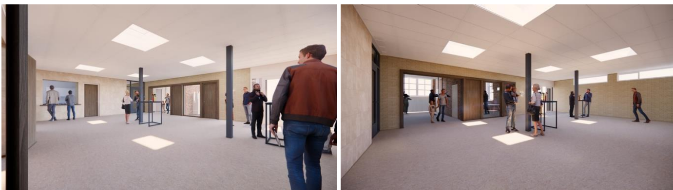
Impressie van de ruime ontmoetingsruimte en het meer zichtbare kerkelijk bureau.

Tijdens de verbouwing wordt de uitstraling van het pand gemoderniseerd. Zo wordt ook de tussengevel van het monumentale deel van Eben-Haëzer, het deel rechts van de ingang, aangepakt. Door grotere openingen te maken, wordt het interieur ruimtelijker en is vanuit het kerkelijk bureau meer zicht op de ontmoetingsruimte. Hieronder zijn impressies van de vernieuwde hal te zien.